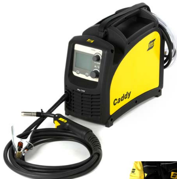
Fourni avec bandoulière.