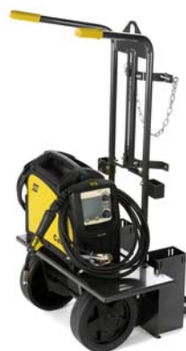
Chariot - pour un transport facile des bouteilles de gaz et Caddy® Mig.